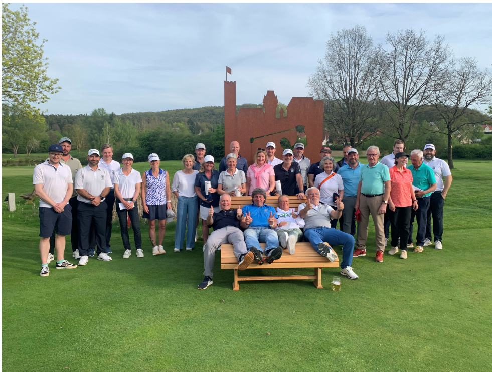
Foto mit den Siegern des 26. Pro Am Turniers im GC Abenberg